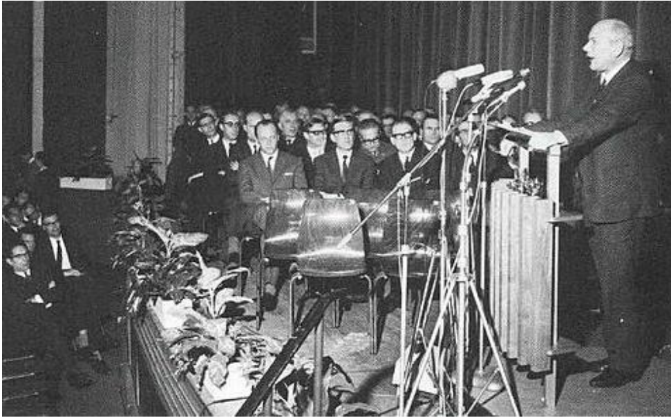
Bron 6: Joop den Uyl in de Stadsschouwburg van Heerlen op 17 december 1965